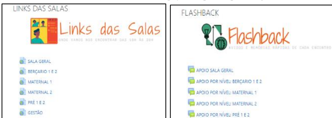
Figura 4- Print dos espaços de apoio à aprendizagem