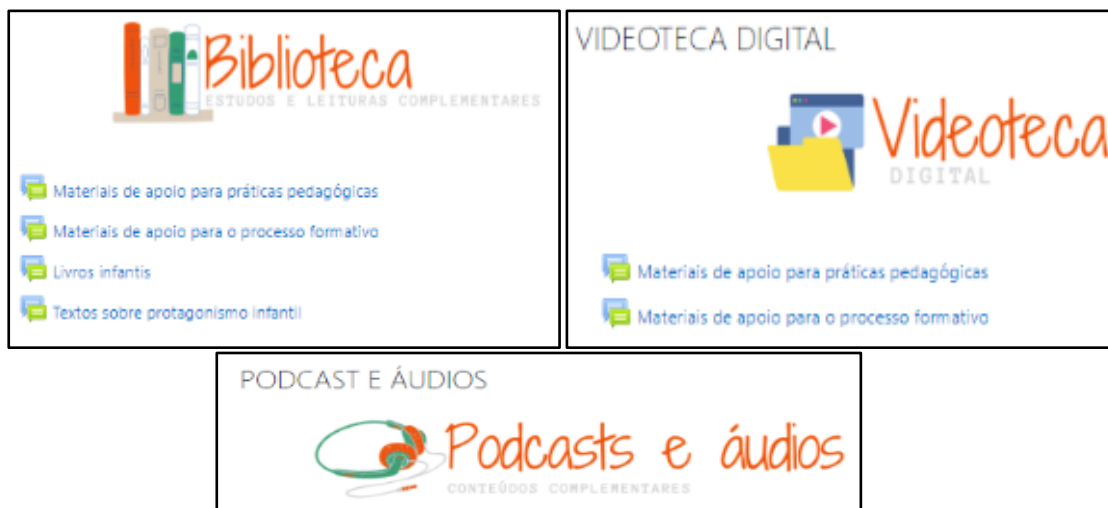
Figura 2- Print dos espaços criados para os materiais complementares