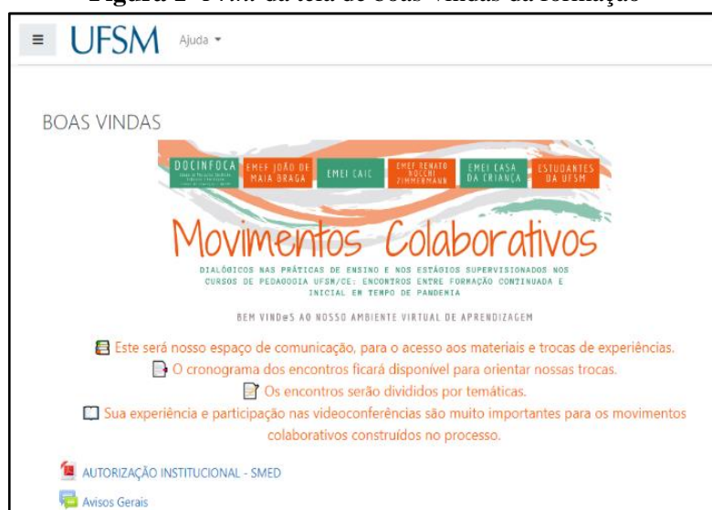
Figura 1- Print da tela de boas-vindas da formação