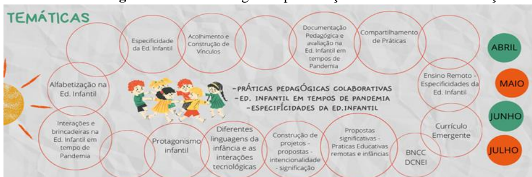
Figura 3- Print do design de apresentação das temáticas da formação